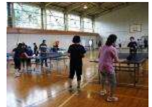
男女混合ペアで楽しみました