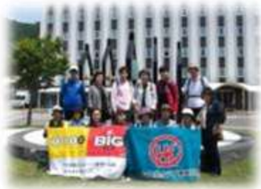
復興の鐘をバックに