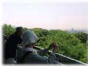
愛宕山記念公園展望台