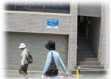
3.11の津波の高さを示す看板

7月10日(日)、一行15名は一路釜石へ。釜石駅では蒸気機関車の出迎えを受け、駅前では復興の鐘を鳴らして復興を願い、薬師公園からは商店街、その先にある釜石湾まで見渡せました。東日本大震災前の商店街は道路の両側に屋根付のアーケード街でしたが、アーケードは全て撤去されていて、道路の中が広がっていました。商店街は日曜休みで人通りも疎らでした。表通りの店舗はところどころ更地となっていて、通りと裏通りを行き来できる所が目につきました。