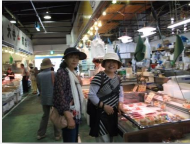
魚菜市場での買い物