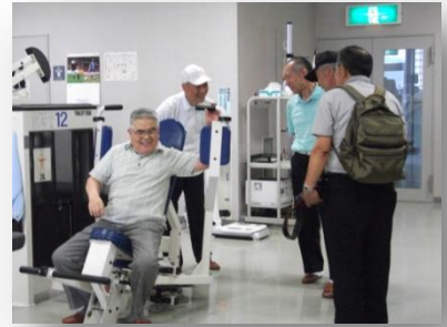
シーアリーナトレーニングルーム