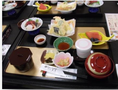
味処『海舟』での昼食