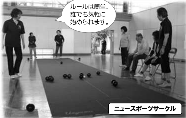
ニュースポーツサークル